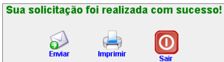
Ilustração 5: Opções após confirmação da solicitação.

Neste passo a sua solicitação está salva em nosso banco de dados. Se preferir, você tem as seguintes opções: