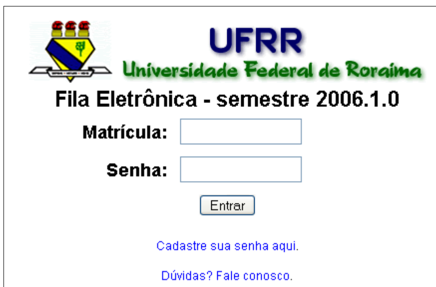
Ilustração 2: Formulário de identificação.

Após clicar em 'Gravar', a mensagem ' Senha cadastrada com sucesso. ' confirmará a operação. Voltando à página principal do sistema, digite a sua matrícula e sua senha cadastrada anteriormente.